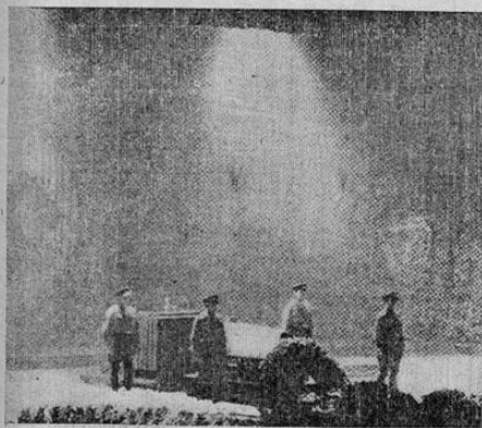
Los restos de Wilhelm Gustloff en el cuartel general de los nazis en Múchich

En Suiza se rompió el derecho a la libertad de ferr y hubo la restricción en la literatura, según dijo el cable, en su oportunidad, para prohibir especialmente y por la influencia nazi, el libro de Emil Ludwig llamado "El Crimen de Davos". Como recordarán nuestros lectores, el joven Frankfurter mató a Gustloff representan-