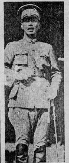
CHIANG KAI SHEK ASUMIO DE NUEVO EL MANDO EN NANKING

CHANG SUEH LIANG LLEGO A NANKING NANKING, 26 UP. — El jefe del gobierno de Nanking, general Chiang Kai Shek llegó ayer a Nanking. La Central News informa desde Shanghai que el mariscal Chang Sueh Liang también llegó a Nanking en compañía de T. V. Soong, en cuya residencia se encuentra en estos momentos, según informes facilitados por el general Hoying Chin.